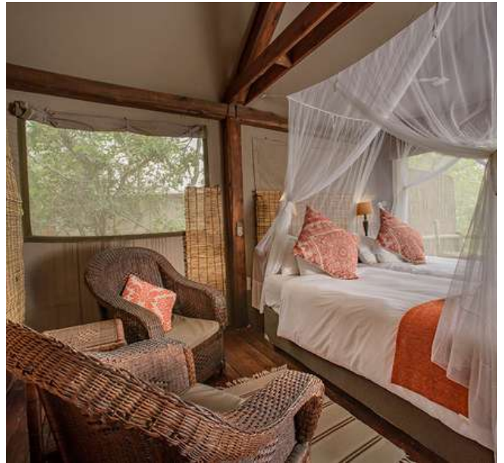
Safari Camp en el P.N Kruger.

De camino al P.N Kruger, por la Ruta Panorámica, nos detendremos en el mirador del Blyde River Canyon, con unas vistas espectaculares.