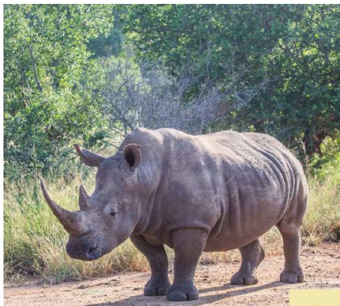
Rinoceronte blanco en el P.N Hlane.