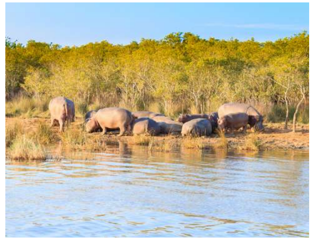
Navegación en St. Lucía.