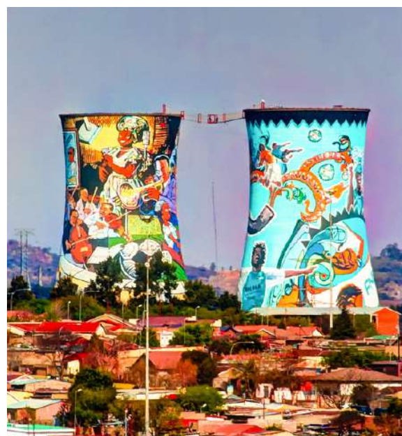
Las emblemáticas chimeas de Soweto

En Ciudad del Cabo, donde disfrutaréis de tiempo libre, tendréis oportunidad de realizar actividades variadas, como por ejemplo, visitar los interesantes museos de la ciudad, el mítico Cabo de Buena Esperanza o subir a la conocida 'Table Mountain', que aparece en la mayoría de postales de África Austral.