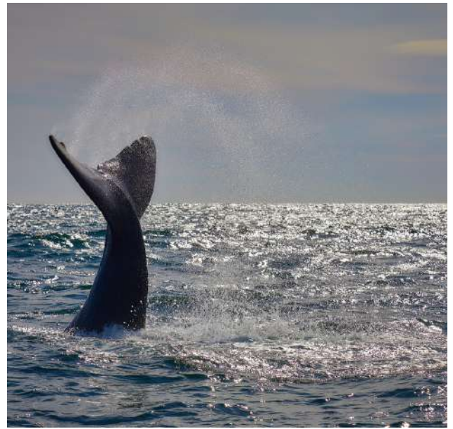
Avistaje de ballenas en Hermanus.