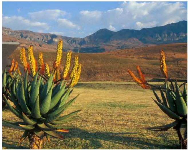
Preciosos paisajes en Drakensberg.