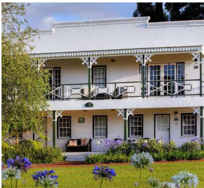
Tsitsikamma Village Inn. Ruta jardín.