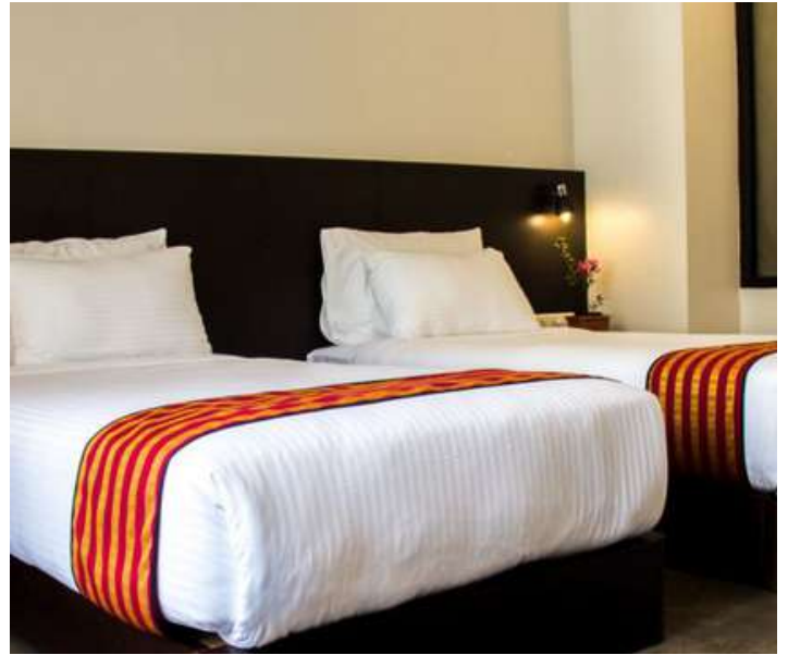
Hotel Bhutan Ga Me Ga

Hotel Thimphu Towers o similar. Comidas incluidas: Desayuno / Almuerzo / Cena