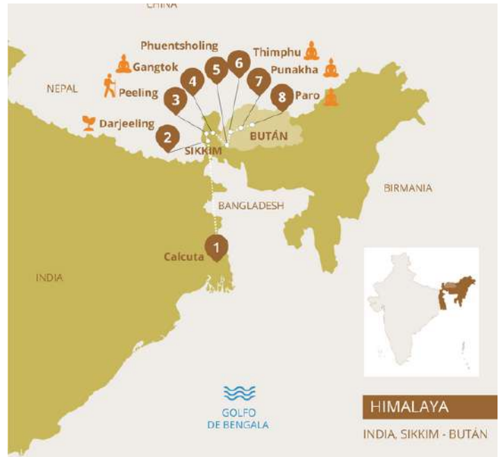
Mapa de Ruta

Esto va a suponer una única y memorable experiencia y es el punto destacado de este gran viaje. En Thimphu, la capital del país, ubicada en un hermoso y fértil valle. Si bien alberga la residencia del monarca, la ciudad no tiene semáforos y cuenta con sólo una calle comercial.