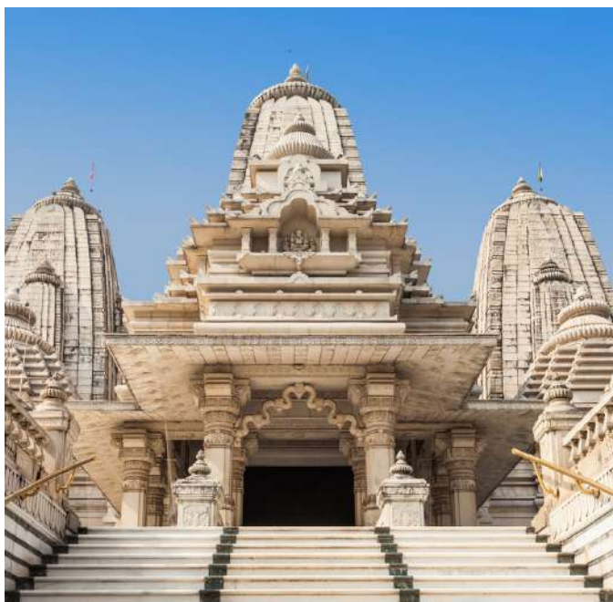
Templo Birla Marlin, Calcuta

Llegada a Calcuta, asistencia y bienvenida al llegar al aeropuerto por nuestro representante y trasladado al hotel. La segunda ciudad más grande de la India, Calcuta, es un festival visual que podrás experimentar a primera vista, es a la vez noble y muy pobre, culta y desesperada. Calcuta es considerada como la capital intelectual y cultural de la India, y como la antigua capital de la India británica. Conserva un festín de arquitectura de la época colonial que contrasta con los barrios marginales urbanos y los dinámicos suburbios con sus centros comerciales. Calcuta es el lugar ideal para experimentar el sabor suave y afrutado de la cocina bengalí. The Park Hotel o similar . Comidas incluidas: Cena