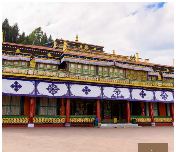
Monasterio Rumtek, Sikkim