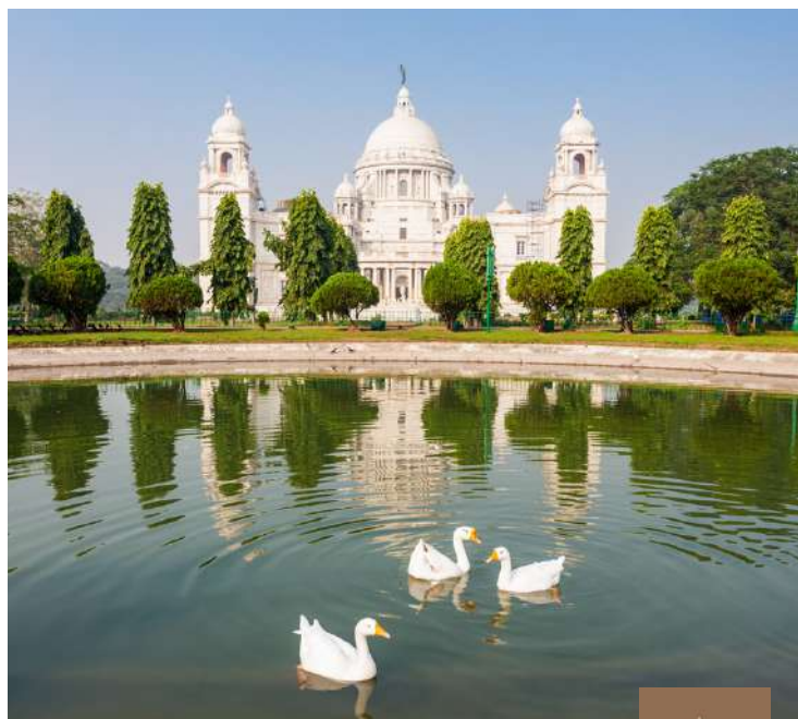
The Victoria Memorial, Calcuta