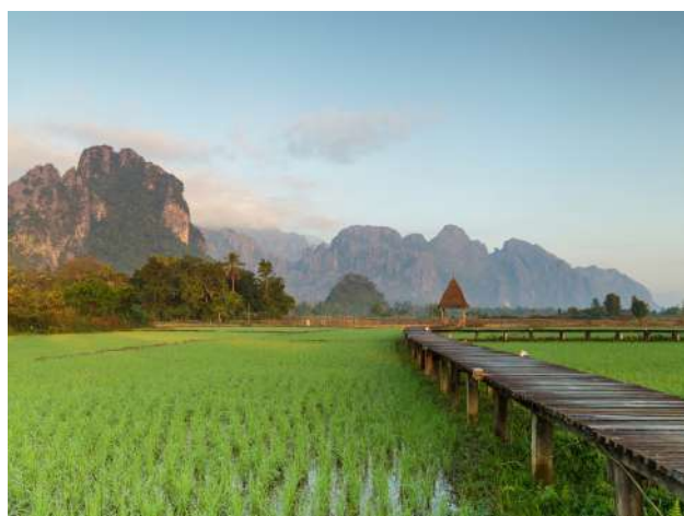
Paisajes en Vang Vieng