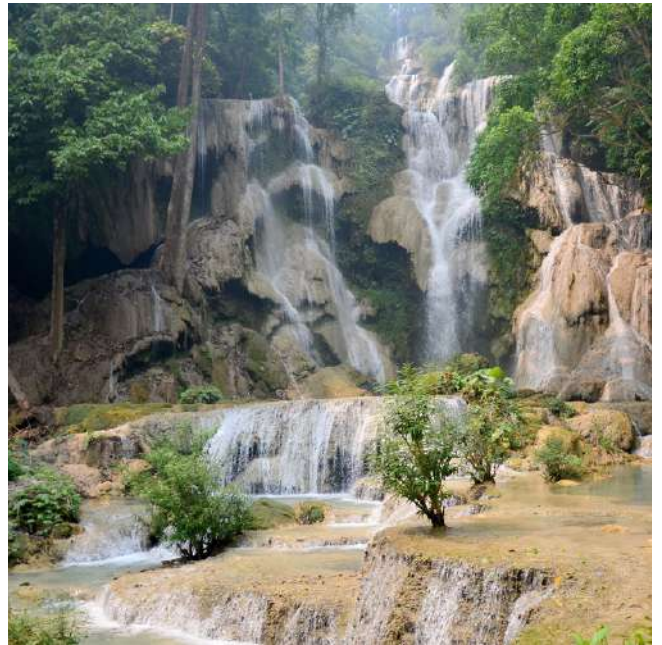
Cataratas Kuang Si