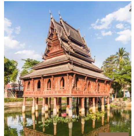
Wat Si Muang