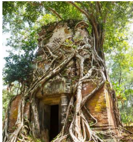
Templo en Koh Ker