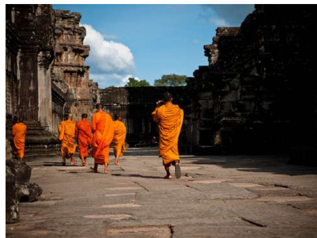
Monjes en Luang Prabang