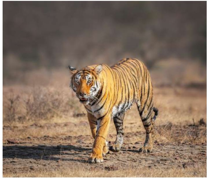
Safari en el P.N Ranthambhore