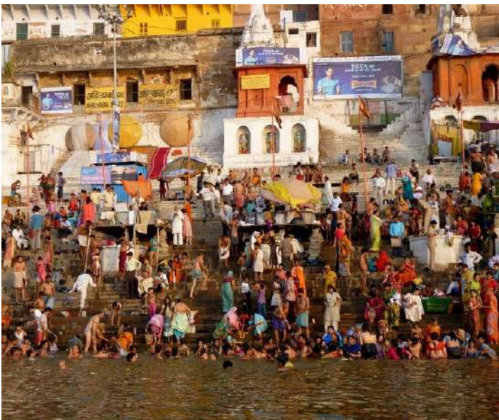
Extensión opcional al río Ganges

Si quieres agregar una extensión de 2 noches al río Ganges para que tu experiencia en el norte de India sea más completa, lo podemos hacer. Trabajamos los programas a petición de cada cliente. ¡Ya no tienes excusas para venir al Norte de India!