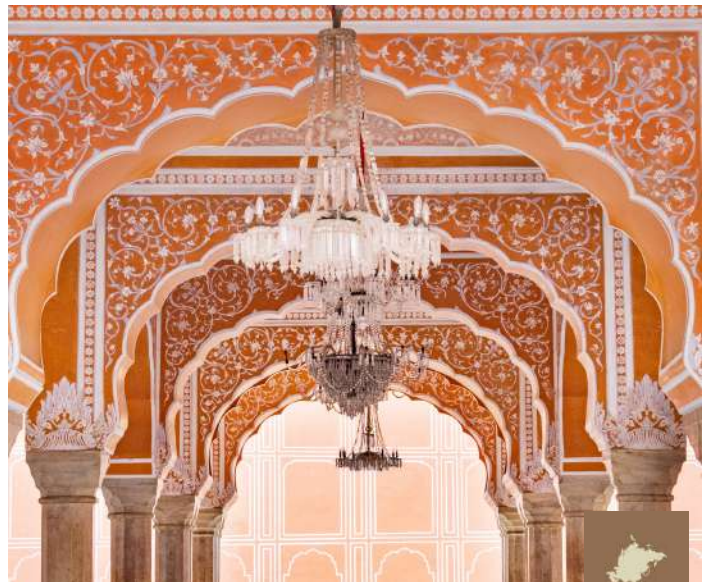
City Palace, Jaipur