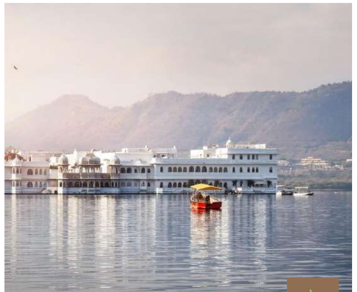
Lago Pichola, Udaipur