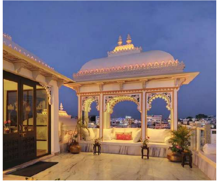
Hotel Boutique Udai Kothi, Udaipur