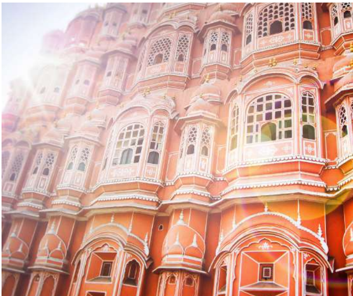
Hawa Mahal, Jaipur